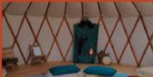
Ferienhaus mit Garten, Salzwasser- Pool und Jurte / familiäres Ambiente